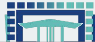
TABLE DES MATIÈRES

UNIVERSITY OF SOUSSE جامعة سوسة Socially Responsible University